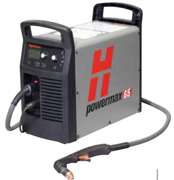
Stile des Duramax-Brenners